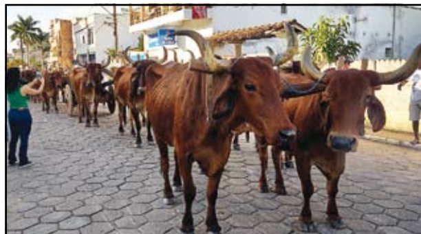
Desfile de Carros de Boi