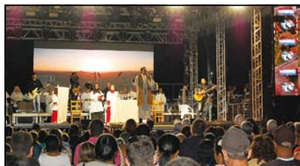
Missa do Impossível no encerramento da Expo BJ