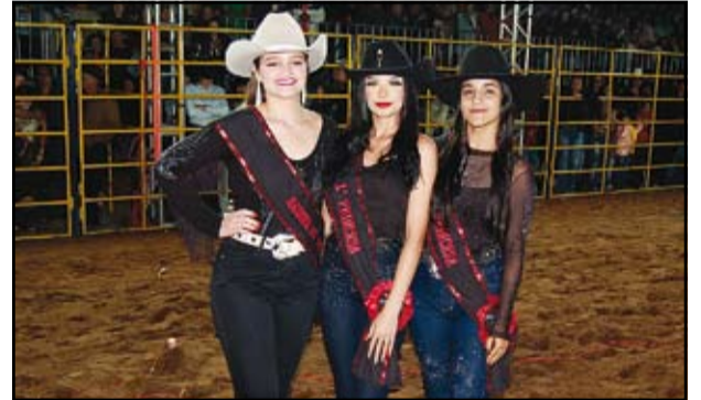
Rainhas do Rodeio