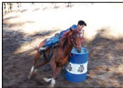
Prova de Tambor