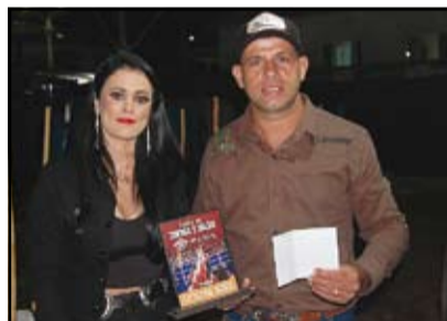
2º Prova de Baliza Aberta Fagundes