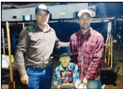
1º Prova de Tambor Aberta - Juarez