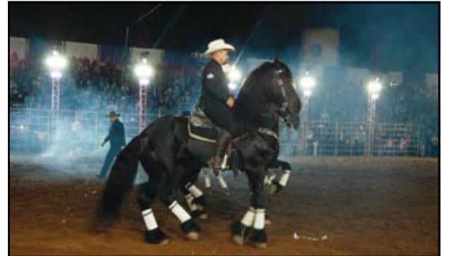
Apresentação de cavalos adestrados