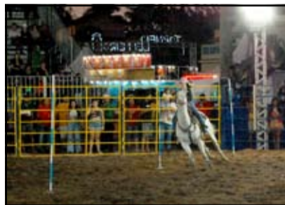
Prova de Baliza