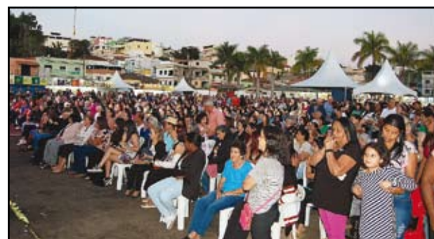
Missa do Impossível no encerramento da Expo BJ