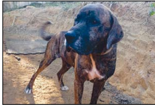
Animal para adoção: Fila Brasileiro. Este cão é dócil, obediente, leal, determinado e corajoso.

Há vários motivos que levam uma pessoa a comprar ou adotar um cão. Muitas vezes é para proteger a casa, outras para espantar a solidão, algumas para agradar uma criança. Seja qual for a motivação, um cão ou gato é um animal de criação diferente, pois, ao contrário de galinhas, porcos e vacas, não são criados para consumo, não vão terminar na panela. Há quem goste mais de cachorro; outros preferem os bichanos, mas o que todos compartilham é do amor que esses animais compartilham. Eles se entristecem quando nos veem amuados, nos defendem de qualquer ameaça, abanam o rabo mesmo quando são repreendidos e dizem até que são para-raio de doenças e energias negativas.