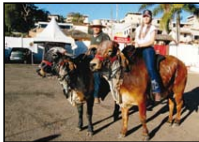
Desfile de animais