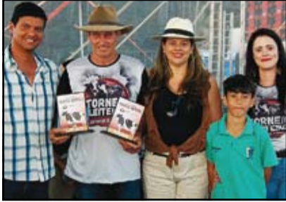
3º Lugar Grande Campeã