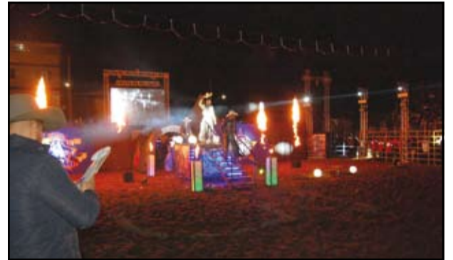
Abertura do Rodeio