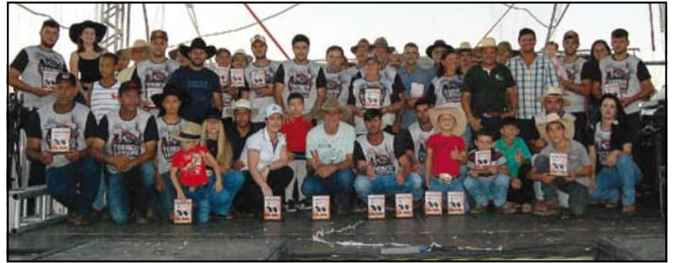
Produtores e Comissão Organizadora

O evento foi concluído com chave de ouro no dia 5 de maio, com a premiação do Torneio Leiteiro. Este encerramento marcou o fim de uma semana que cele-