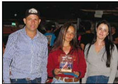
1º Lugar Prova de Tambor Feminina