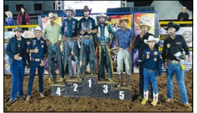
Premiação do Rodeio Profissional