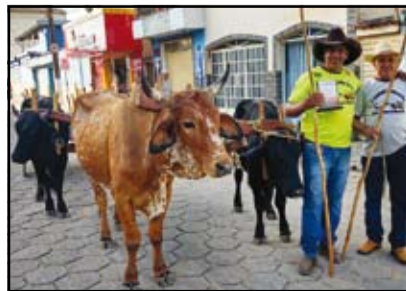
Desfile de animais