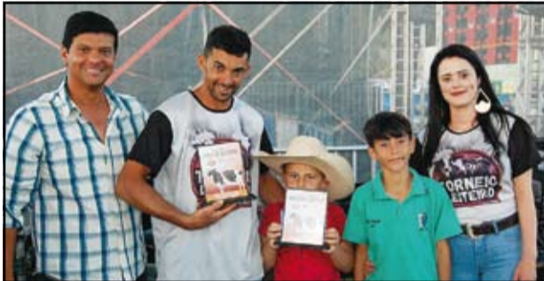
1º Lugar Curraleira - Animal Babilônia - Produtor Nunes