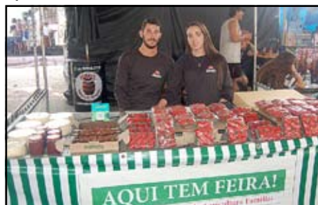
Leal Morangos - Carvalhos