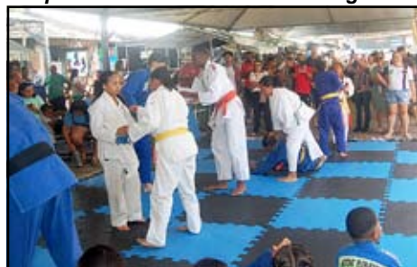
Competição de Judô