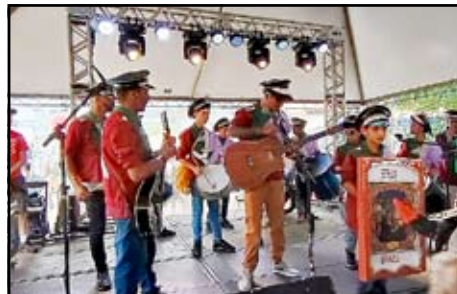
Folia de Reis