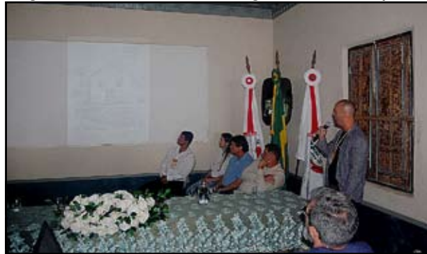
Lançamento do 2º livro do Caminho do Comércio