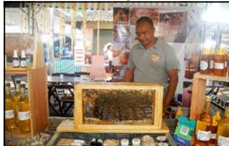
Apiário Severo - Enxame de abelhas