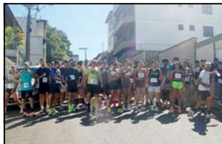
Corrida Rustica e caminhada