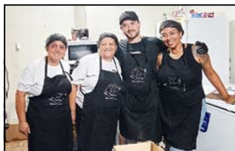
Delícias da Rê