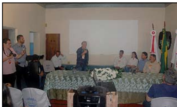
Rodada com os prefeitos das cidades do Caminho do Comércio

O 2º Encontro dos Pesquisadores do Caminho do Comércio consolidou Bom Jardim de Minas como referência na preservação da memória regional e reforçou o potencial turístico dessa rota bicentenária, que une história, cultura e paisagens únicas entre Minas Gerais e o Rio de Janeiro.