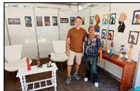
Projeto Cultural de São Vicente de Minas