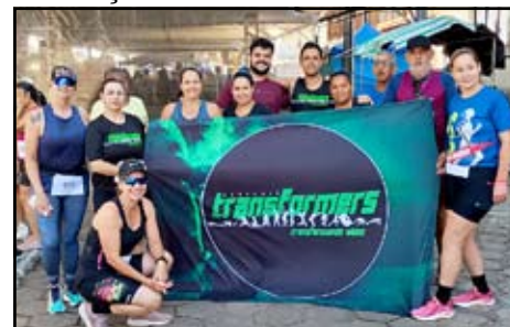
Grupo de Corrida ransformes