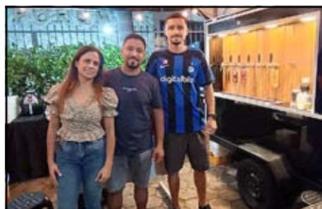
R&R Empadas e Chopp Artesanal