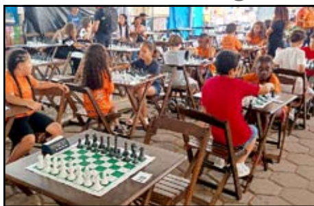
Copa de Xadrez