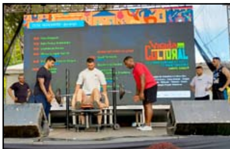
Competição de Supino