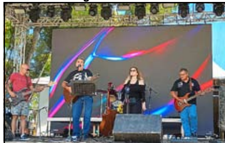
Banda Rock 10