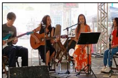
Trio Canto Livre