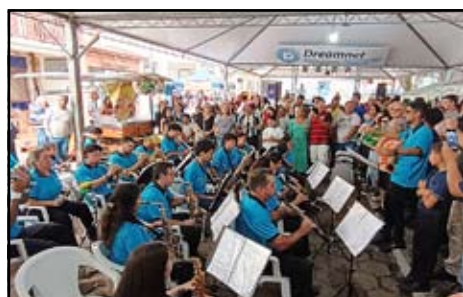
Encontro de Bandas