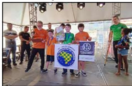
Premiação do Xadrez