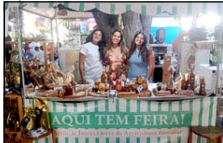
Cora - Confeitaria Brasileira