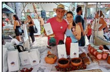
Café Safira e Doces artesanais Vó Tetê