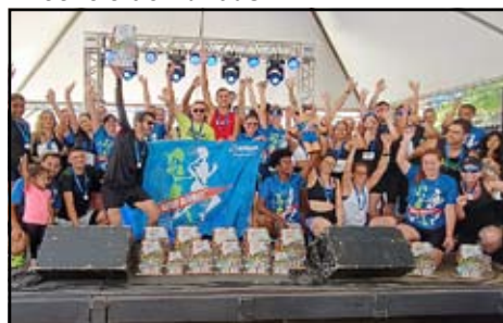
Grupo de Corrida Andrek Running