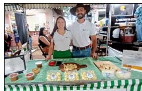
Sítio Vargem da Lagoa