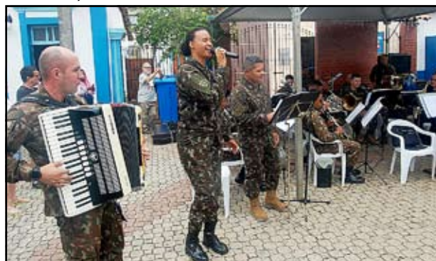
Banda de Música da 4ª Brigada de Infantaria - Juiz de Fora