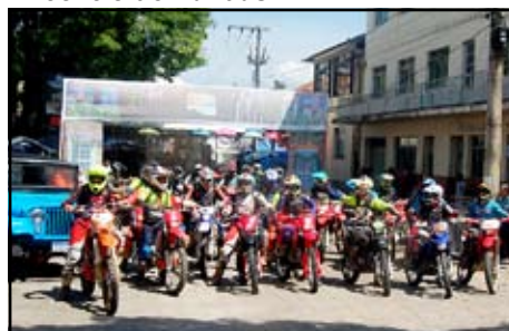
Trilhão de Motos