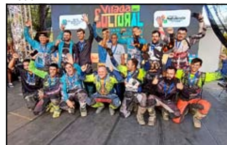
Premiação dos Trilheiros