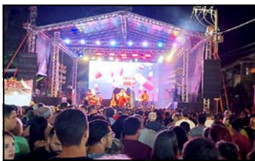
O público lotou todos os dias do evento