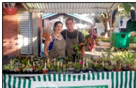
Recanto das Suculentas