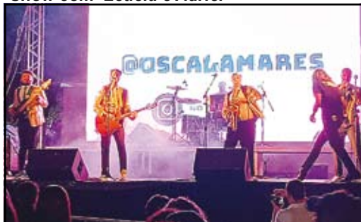
Show com banda Os Calamares