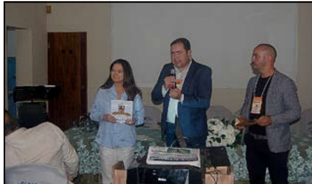
Entrega do kit carimbo e passaporte à Casa Oriven, localizada no Leblon, Rio de Janeiro-RJ