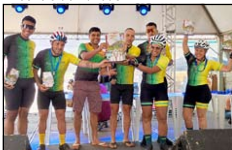
MTB Entre Serras