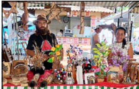
Artesãos de Passa Vinte