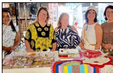
Artesanatos Passa Vinte