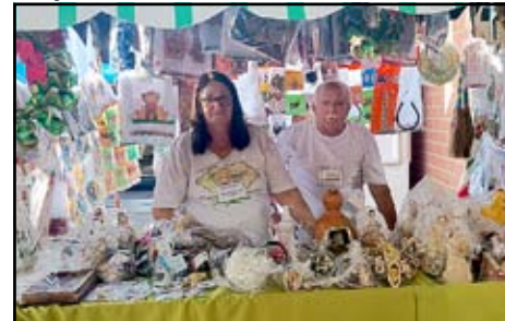
Mãos em Ação - Artesanato reciclado