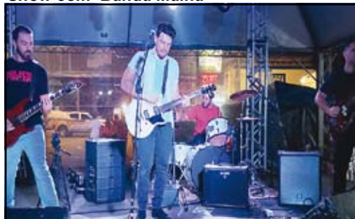
Show com a Banda Arslan