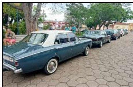
Encontro de Carros Antigo