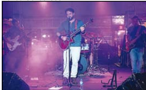
Show com Banda Mainá