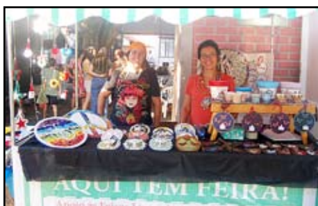
Mosaico e Crochê