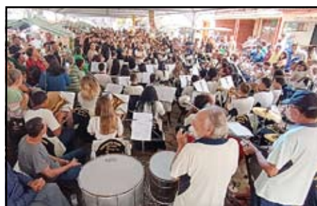
Encontro de Bandas