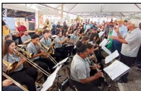
Encontro de Bandas