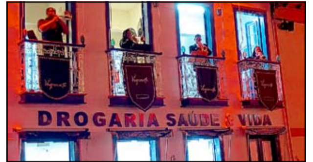
Músicos se apresentam nas sacadas dos casarões, transformando o centro de Diamantina em um grande palco a céu aberto