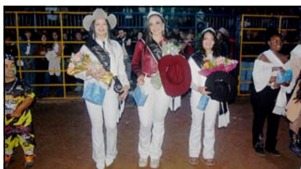
Rainha e princesas do rodeio