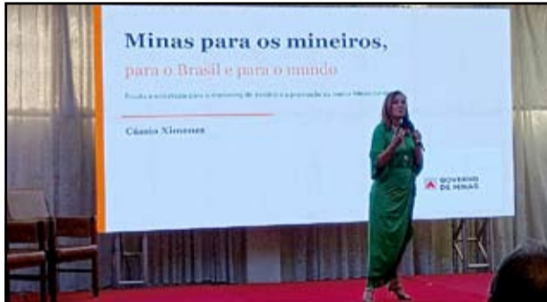
Secretária de Estado de Comunicação, Cássia Ximenes