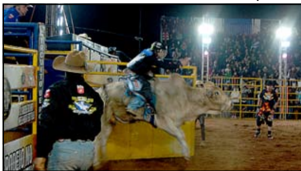
Montaria em touro