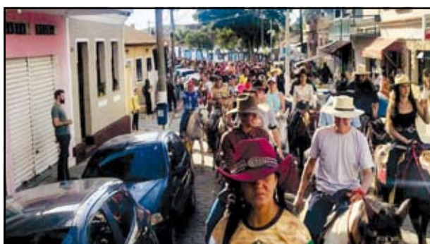
Cavalgada do Trabalhador