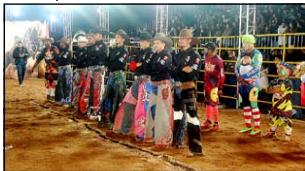
Abertura do rodeio