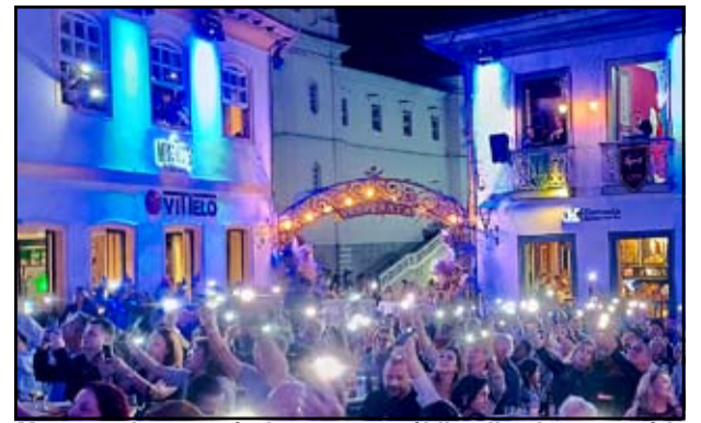
Momento inesquecível quanto o público ilumina o cenário com as lanternas dos celulares

Entre passado e presente, a cidade mantém viva uma tradição que emociona gerações e fortalece sua posição como um dos destinos culturais mais importantes de Minas Gerais.