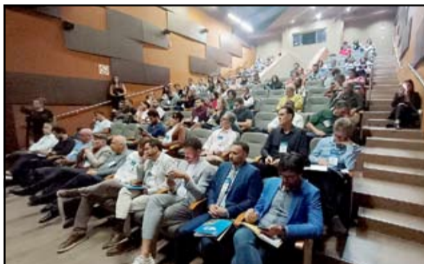
Participantes do evento