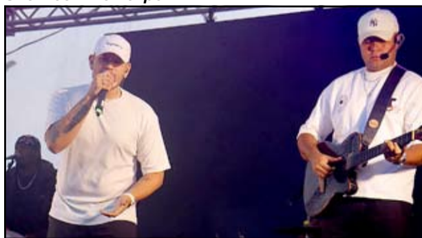
Grupo de Pagode