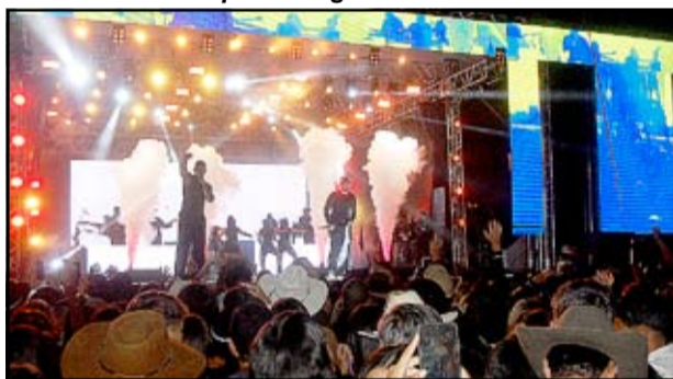
Show com Zé Felipe