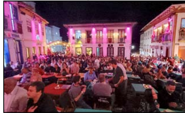
Vesperata de Diamantina - uma experiência única