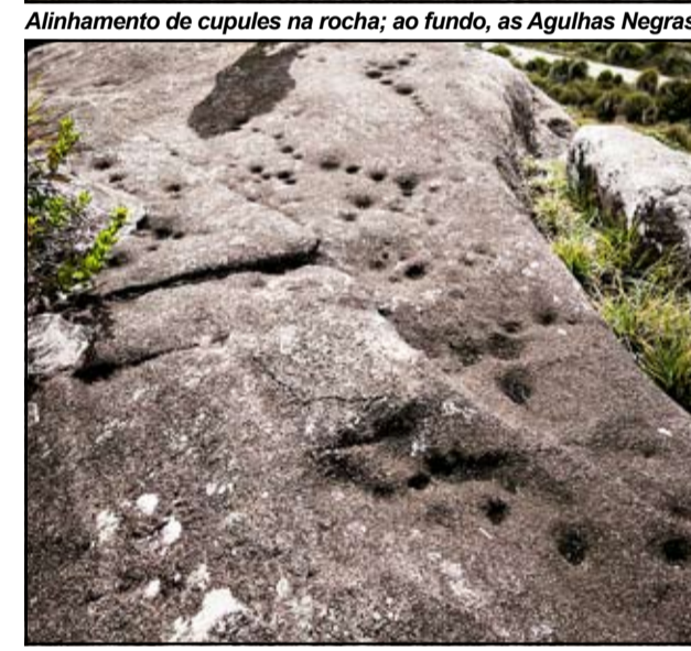
Alinhamento de cupules na rocha; ao fundo, as Agulhas Negras