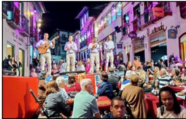
Grupo Chouro Malandrinho na abertura do evento

Reencontrar a Vesperata é perceber que, embora os anos tenham passado, sua essência continua intacta. As