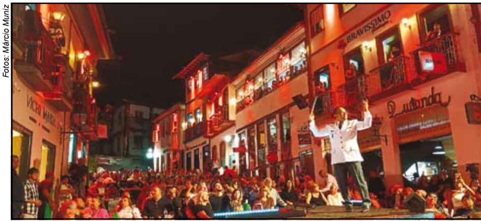
Vesperata de Diamantina - uma experiência verdadeiramente mágica e emocionante

O impacto foi imediato. Encantados com a experiência, os jornalistas levaram a