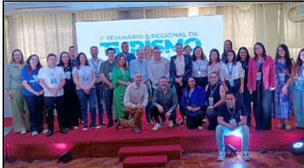
Preitos e secretarios de turismo da IGR