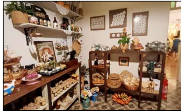
A força do artesanato Mineiro