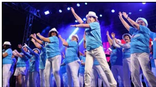
O tradicional Show de Talentos da exposição envolve, todos os anos, toda a comunidade, valorizando artistas locais e promovendo momentos de integração, cultura e entretenimento para o público