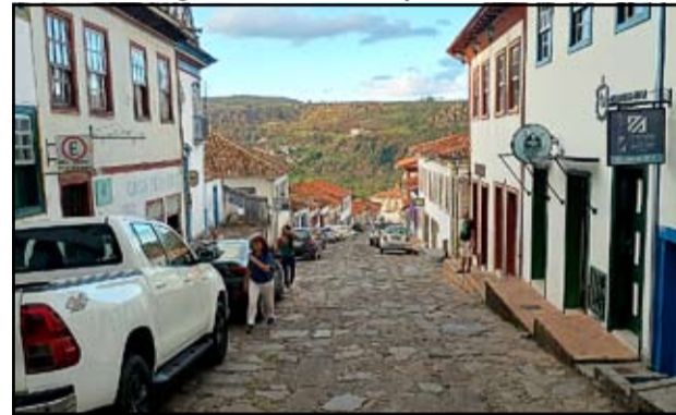
Diamantina - Patrimônio Cultural da Humanidade