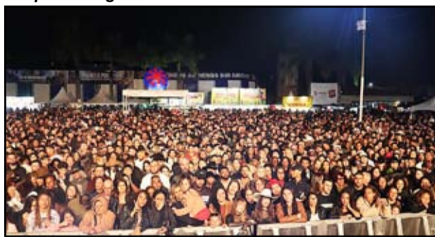
Público presente aos shows