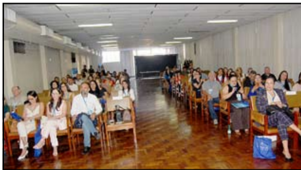
Auditório do Centro de Convenções do Hotel Brasil