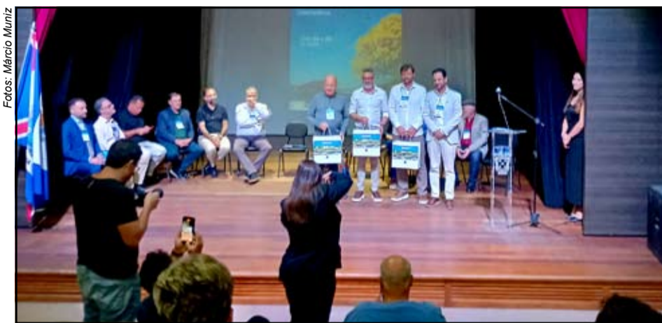
Abertura do Evento