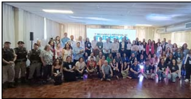
Participantes do Seminário Regional de Turismo