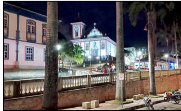
Praças, igrejas e casarões de Diamantina